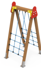
TREPA Nº4 TRP04