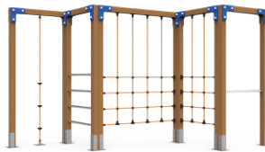
TREPA Nº1 TRP01

Pictures of Equipments/ Images des équipements