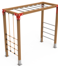
TREPA Nº3 TRP03