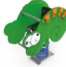
CAMALEÓN INCLUSIVO SLVMDPO1-I