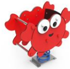
CANGREJO INCLUSIVO MARMPO2-I