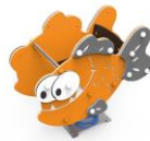
PIRANA INCLUSIVA MARMPO1-I