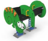
BALANCÍN CAMALEÓN INCLUSIVO SLVBLCO4-I