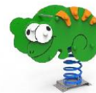
SLVMDP01 MUELLE CAMALEÓN