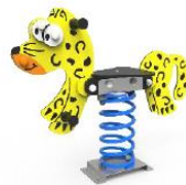
SLVMSP02 MUELLE LEOPARDO