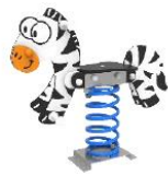
SLVMSP01 MUELLE CEBRA

Pictures of Equipments/ Images des équipements