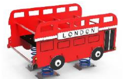
BLC05 LONDON BUS 8 PLAZAS