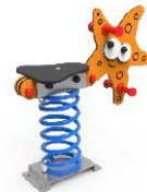
MARMSP01 MUELLE SIMPLE ESTRELLA