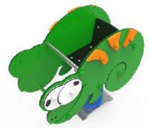
SLVMDP01-I MUELLE CAMALEÓN INCLUSIVO