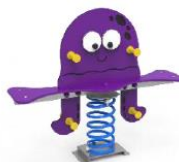
MARMMT01 MUELLE MÚLTIPLE POP