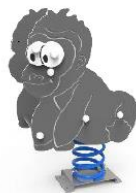
SLVMDP02 MUELLE GORILA