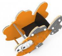
MARMDP01-I MUELLE PIRAFÑA INCLUSIVO