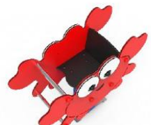
MARMDP02-I MUELLE CANGREJO INCLUSIVO