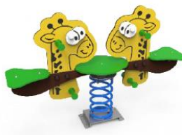
SLVMMT01 MUELLE MÚLTIPLE JIRAFÁ