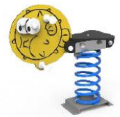
MARMSP02 MUELLE SIMPLE PEZ GLOBO