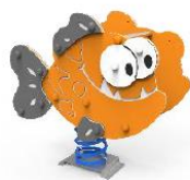
MARMDP01 MUELLE PIRAFÑA