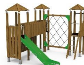
TORRE MADERA TMD01