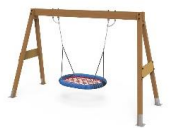
COLUMPIO NIDO MADERA MONCLP01