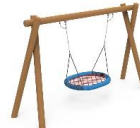
COLUMPIO NIDO ROLLIZO MONCLP02