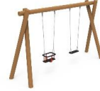
COLUMPIO ROLLIZO BIPLAZA MONCLP04MX MONCLP04PP MONCLP04CC