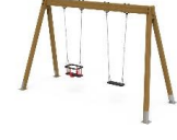
COLUMPIO MADERA BIPLAZA CL01MX CL01PP CL01CC