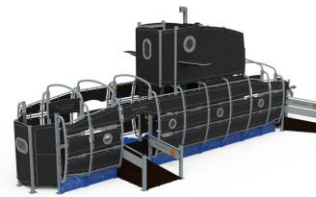
SUBMARINO ISAAC PERAL MARCOM13-I

* Será válida siempre que se superen las evaluaciones periódicas anuales / Valid if the manufacturer pass the annual surveillance visits / Valable l'orsque le fabricant passe les visites annuelles de surveillance