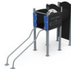
TORRE DESLIZADORA MARCOM12